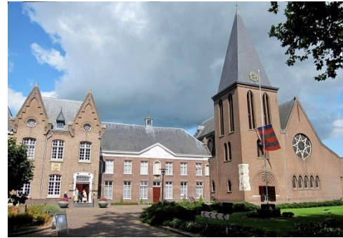
Abdy van Berne-Heeswijk