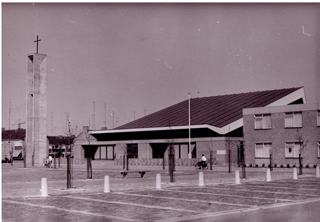
Exterieur H. Geestkerk aan het Rivierenplein

Verder ontstonden er jongerengroepen, die helaas geen een lang leven beschoren waren. Andere groepen, zoals de liturgische werkgroep, een werkgroep voor moeders voor het samenstellen van gezinsvieringen waren jarenlang actief in de parochie.