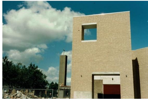
Foto: Oude en nieuwe toren van H. Geest aug. 1995