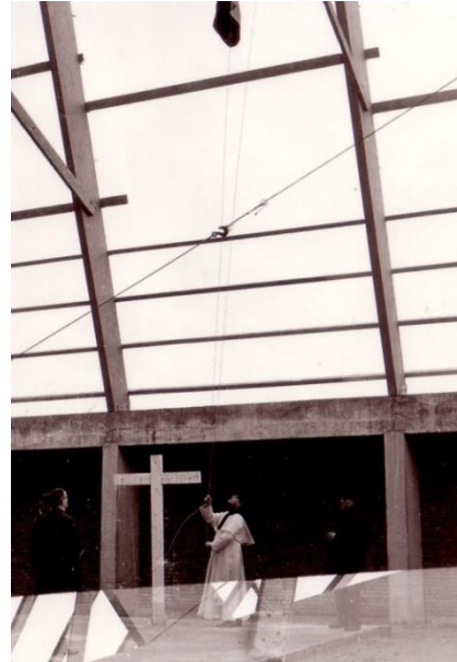
12 februari 1965 hoogste punt bereikt H. Geest.

Uitgangspunt voor de pastoor was dat de kerk de ideale mogelijkheid zou bieden aan de parochianen om in een sfeer van gemeenschappelijke verbondenheid de eucharistie te kunnen vieren. Om aan die wens van de pastoor te voldoen trok hij door het hele land om kerkgebouwen op hun geschiktheid te bekijken. De ontwerpen van architect Lelieveldt voldeden precies aan wat de pastoor zocht. Hij was de man van wie de pastoor het beste resultaat verwachtte, en die hem niet zou teleurstellen.