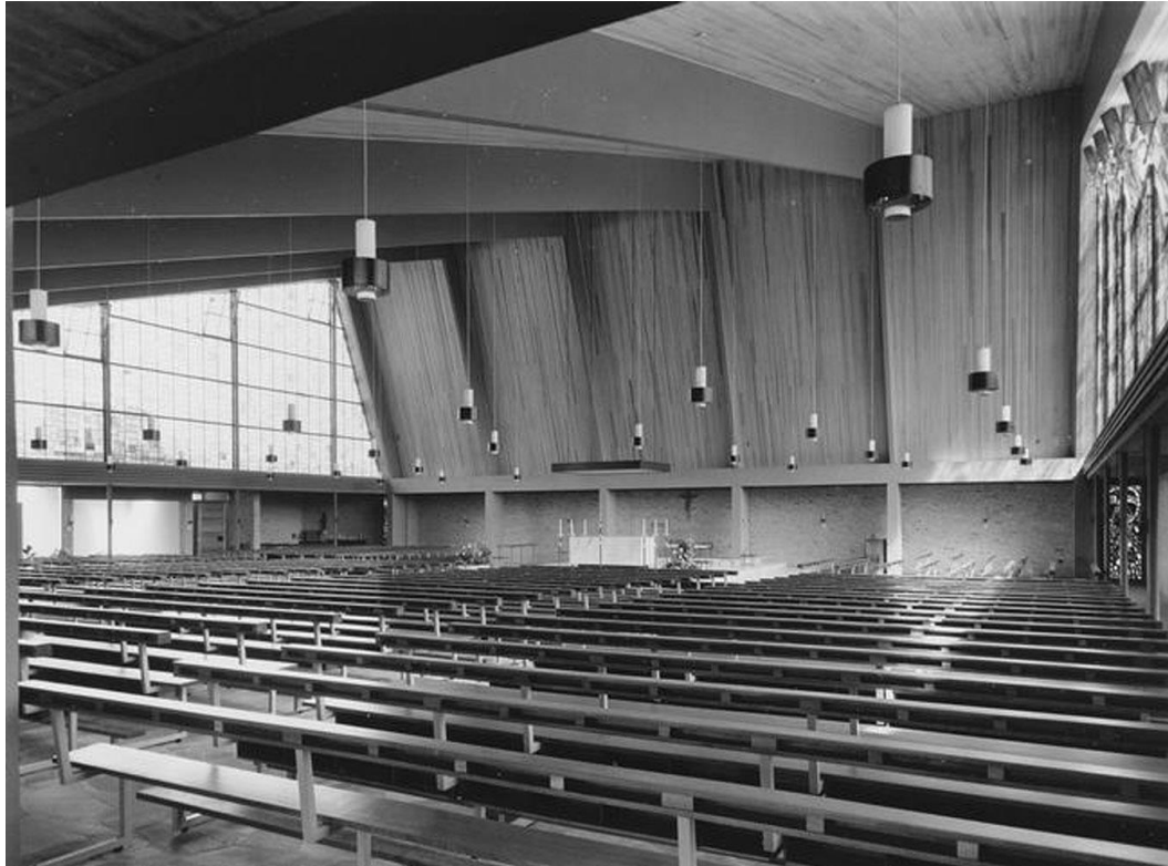
Interieur van de H. Geestkerk