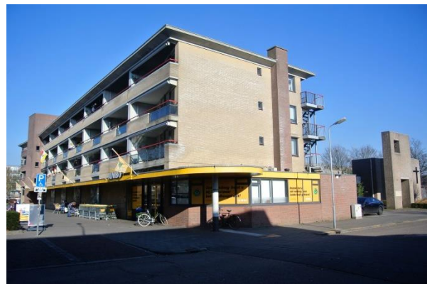
Het Rivierenplein nu. Rechts het vm. Kerkgebouw parochie H. Geest